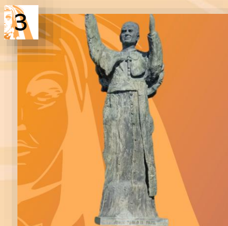
Visita Juan Pablo II a Alba de

Ubicación: Plaza del peregrino (Basílica de Santa Teresa)