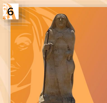
Santa Teresa andariega