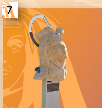
Soy hija de la iglesia. Acción extraordinaria del Espíritu Santo.

Autor: Valeriano Hernández (España). Ubicación: Calle Carlos III .